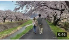
動画 東京物語 小津安二郎